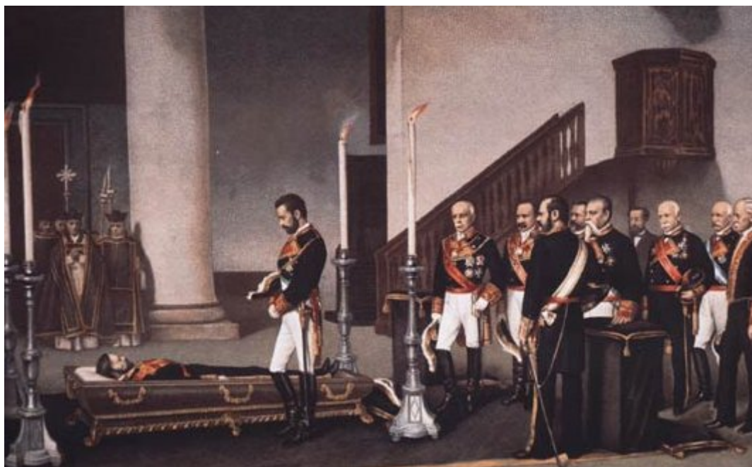
“Amadeo de Saboya frente al féretro del general Prim” de Antonio Gisbert.

FUENTE HISTÓRICA: Relacione este cuadro con el reinado de Amadeo de Saboya y la I República.