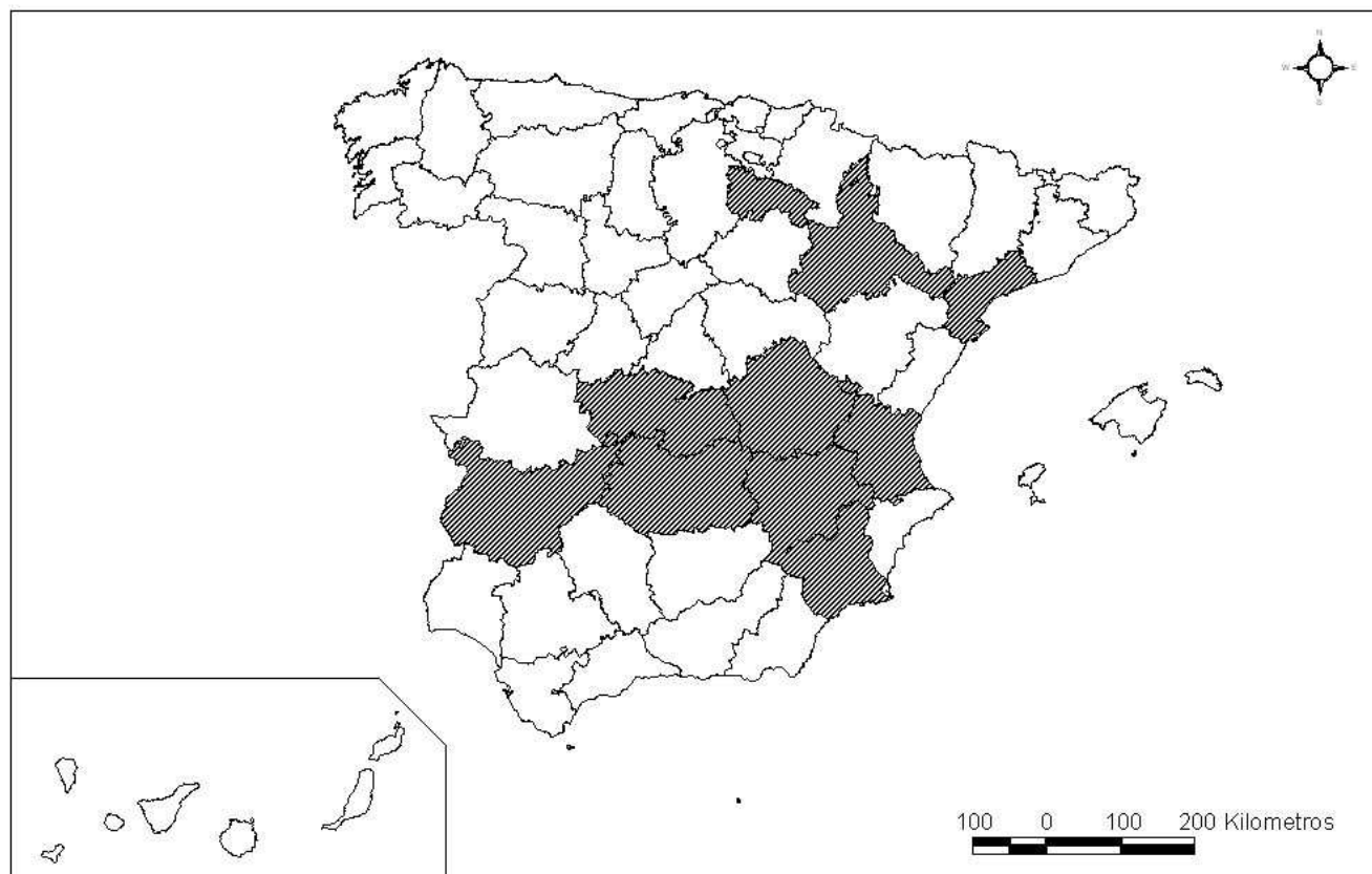
PROVINCIAS CON MÁS DE 25.000 HECTÁREAS DE VIÑEDO DE SECANO (1999)