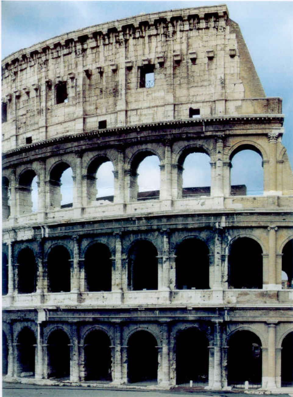
Hª DEL ARTE LOGSE