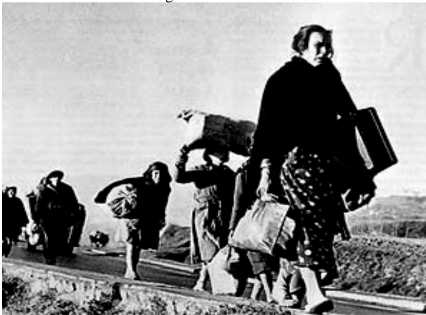
Fotografía de Robert Capa de un grupo de españoles camino del exilio a Francia.

FUENTE HISTÓRICA: Relacione esta fotografía con el exilio durante la dictadura franquista.